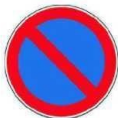
Señal tipo R-308