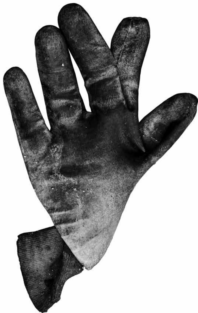
MANUFACTURA 3 • fotografía sobre lona, 150 x 100 cm, 2024