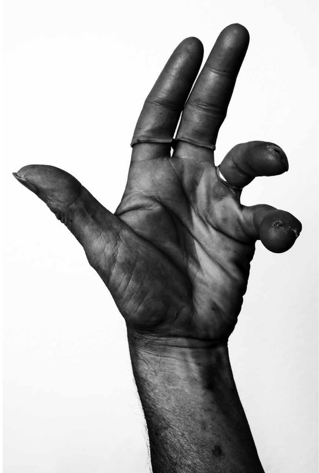
DEDOS • fotografía sobre lona, 150 x 100 cm, 2024