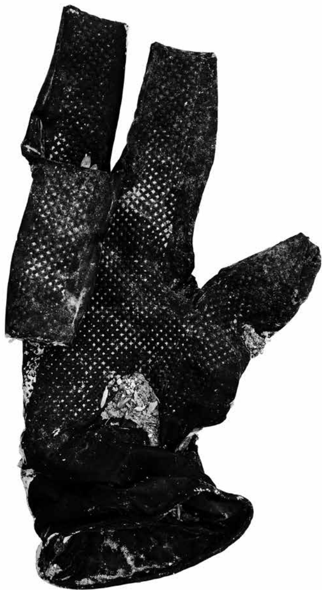
MANUFACTURA 7 · fotografía sobre lona, 90 x 60 cm, 2024