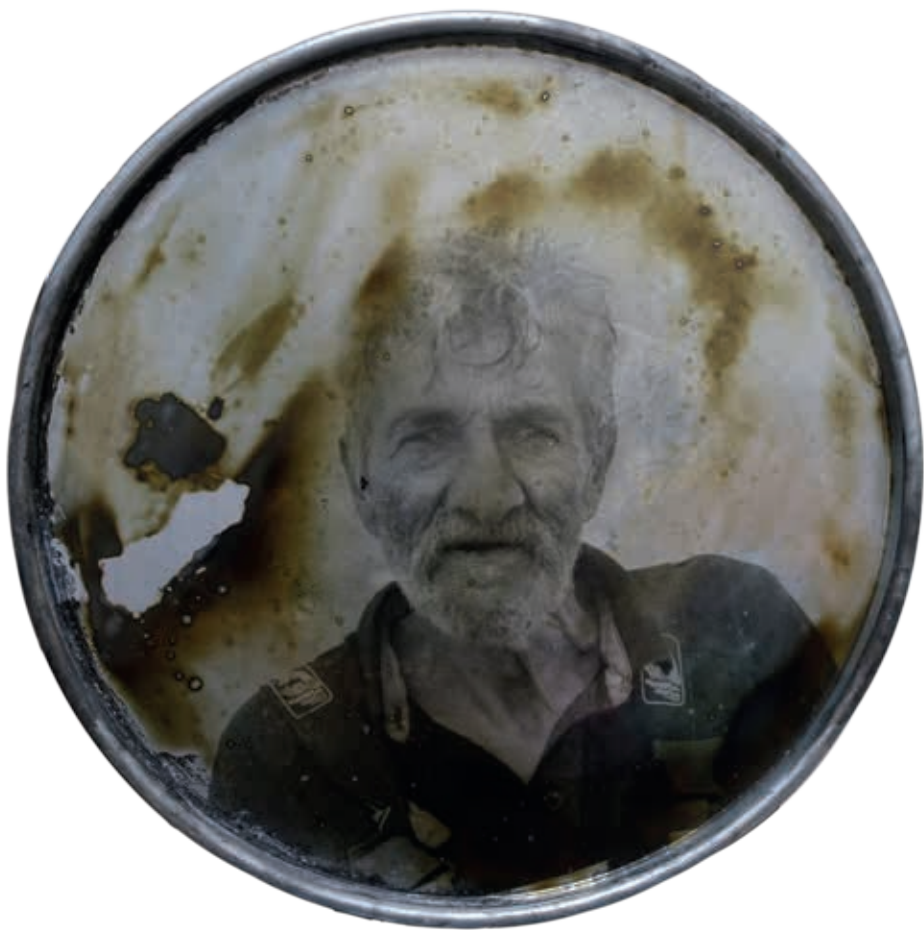
CORROSIÓN 6 • emulsión fotográfica sobre chapa, 60 cm diámetro, 2024