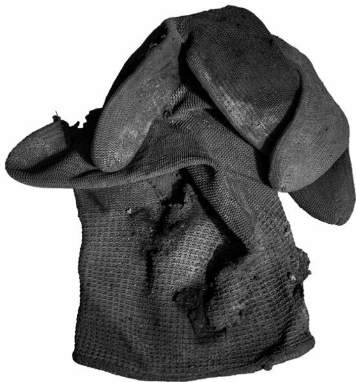
MANUFACTURA 5 • fotografía sobre lona, 90 x 60 cm, 2024