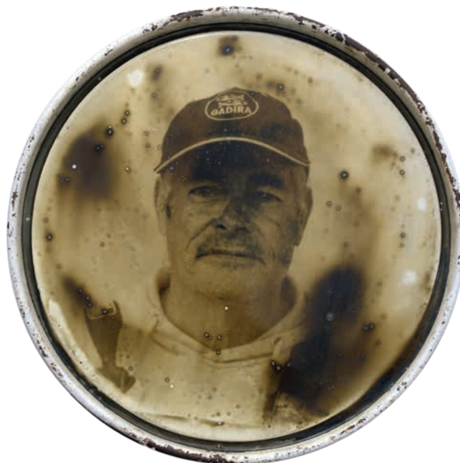
CORROSIÓN 5 • emulsión fotográfica sobre chapa, 60 cm diámetro, 2024