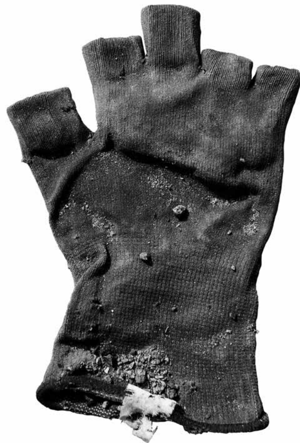
MANUFACTURA 8 • fotografía sobre lona, 90 x 60 cm, 2024