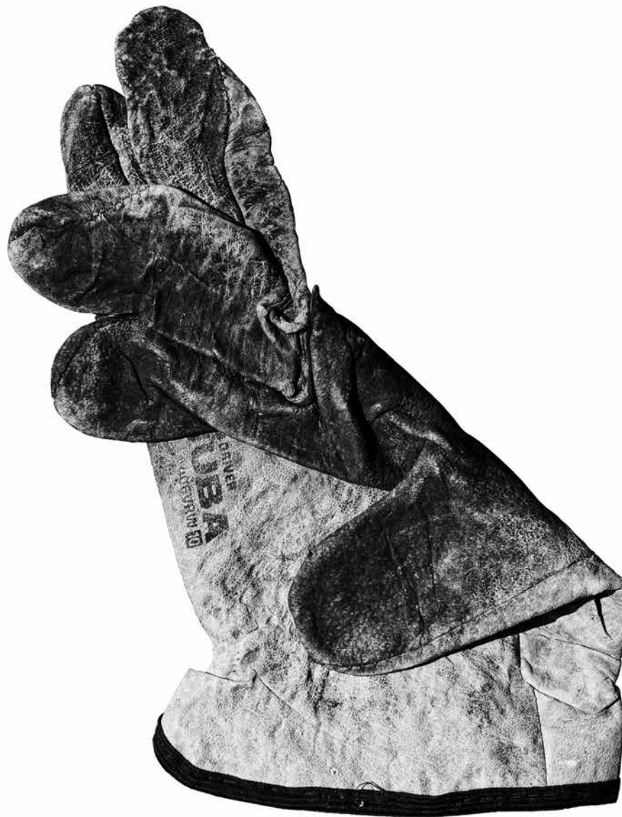
MANUFACTURA 2 · fotografía sobre lona, 150 x 100 cm, 2024