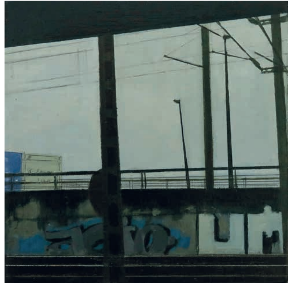
PAISAJE 15 · óleo sobre tabla, 22 x 22 cm, 2025