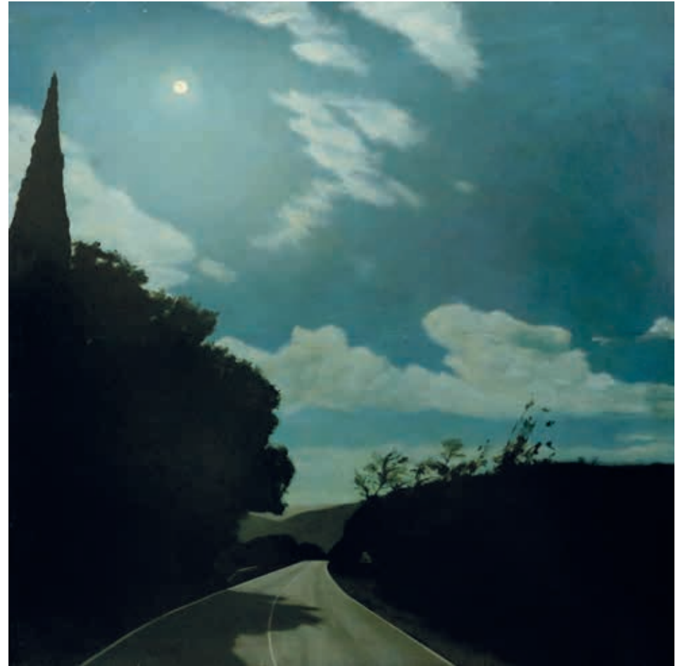
NOCTURNO, LA MUELA, VEJER · óleo sobre tabla, 120 x 120 cm, 2023