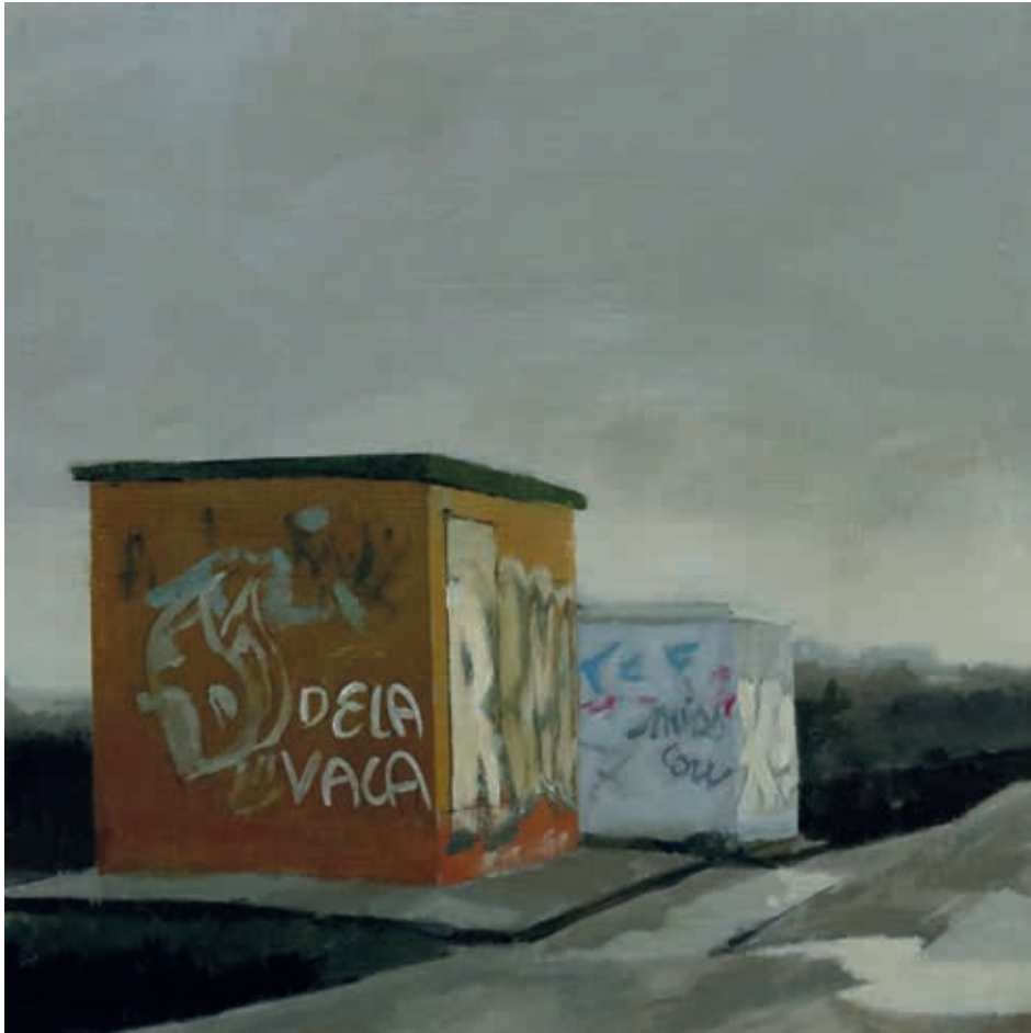
PAISAJE 9 · óleo sobre tabla, 22 x 22 cm, 2025