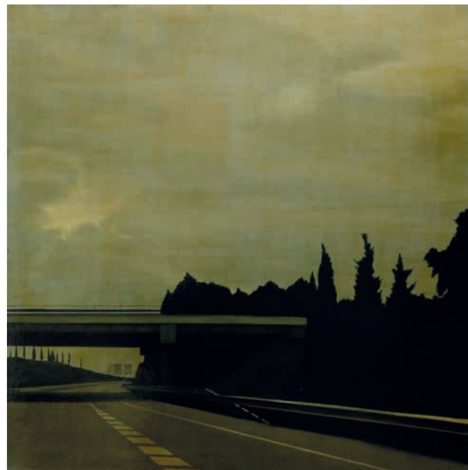
A4 - INCORPORACIÓN · óleo sobre lino, 80 x 80 cm, 2019