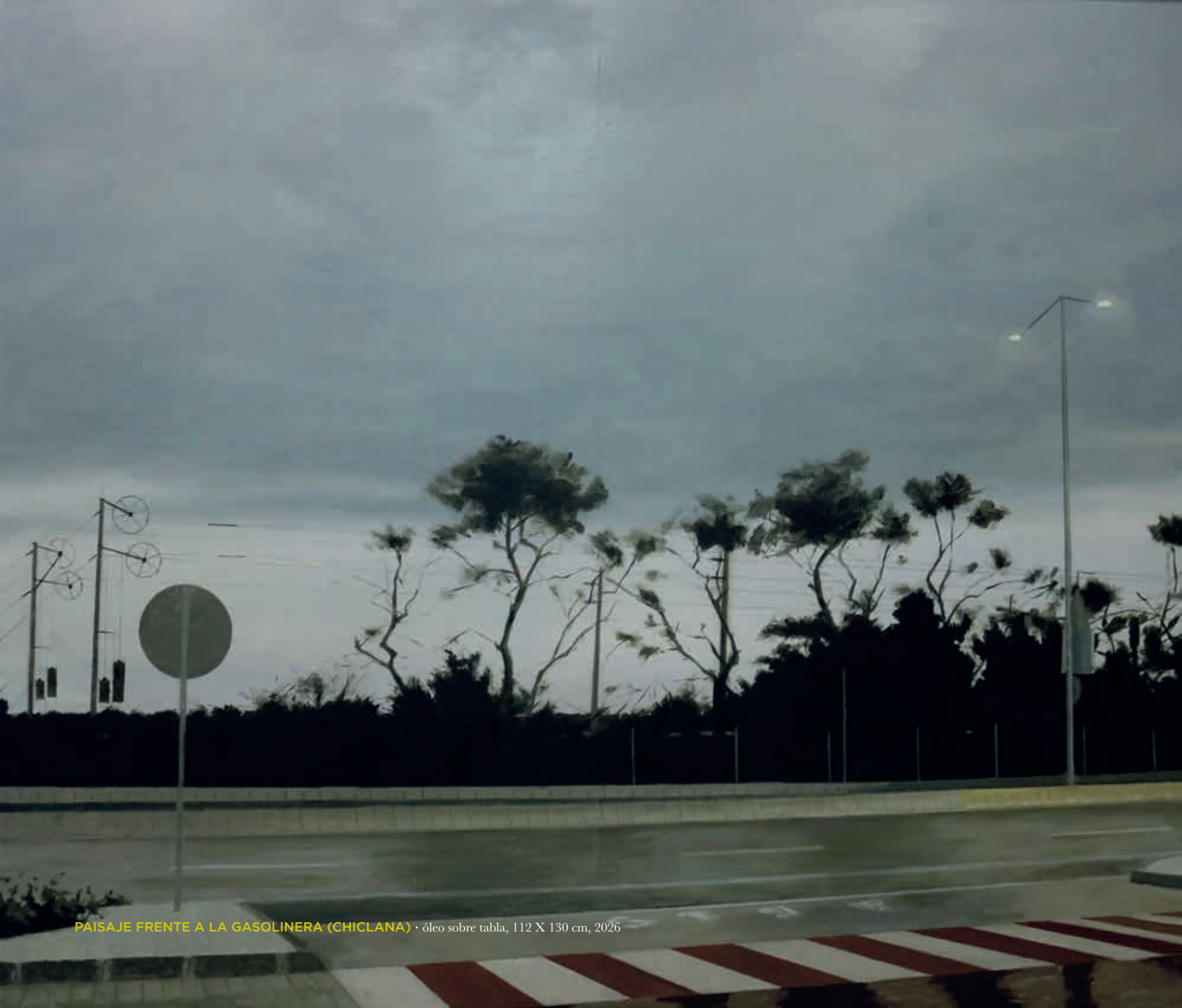
PAISAJE FRENTE A LA GASOLINERA (CHICLANA) · óleo sobre tabla, 112 X 130 cm, 2026