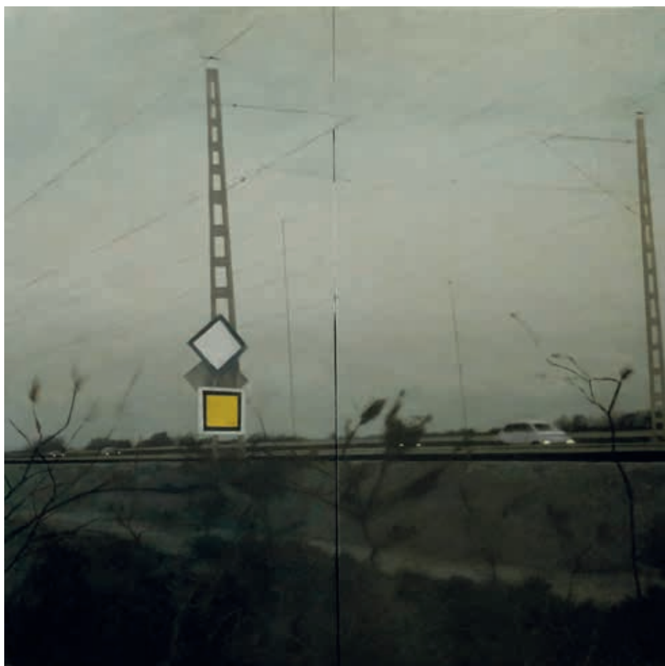
AUTOVÍA CON VIENTO · óleo sobre tabla, 116 x 116 cm, 2024