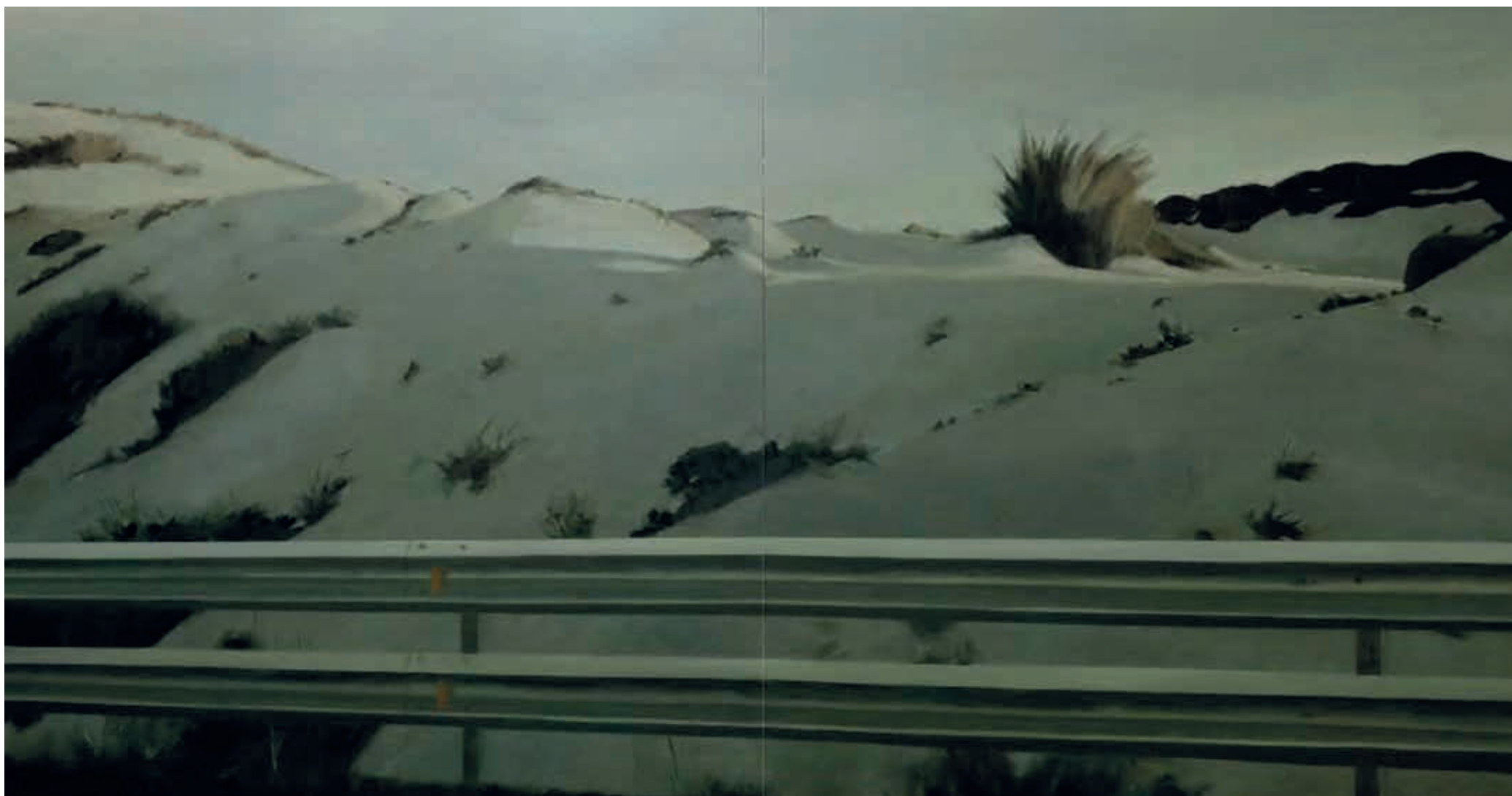
DUNAS, TARIFA • óleo sobre tabla, 80 x 160 cm, 2024