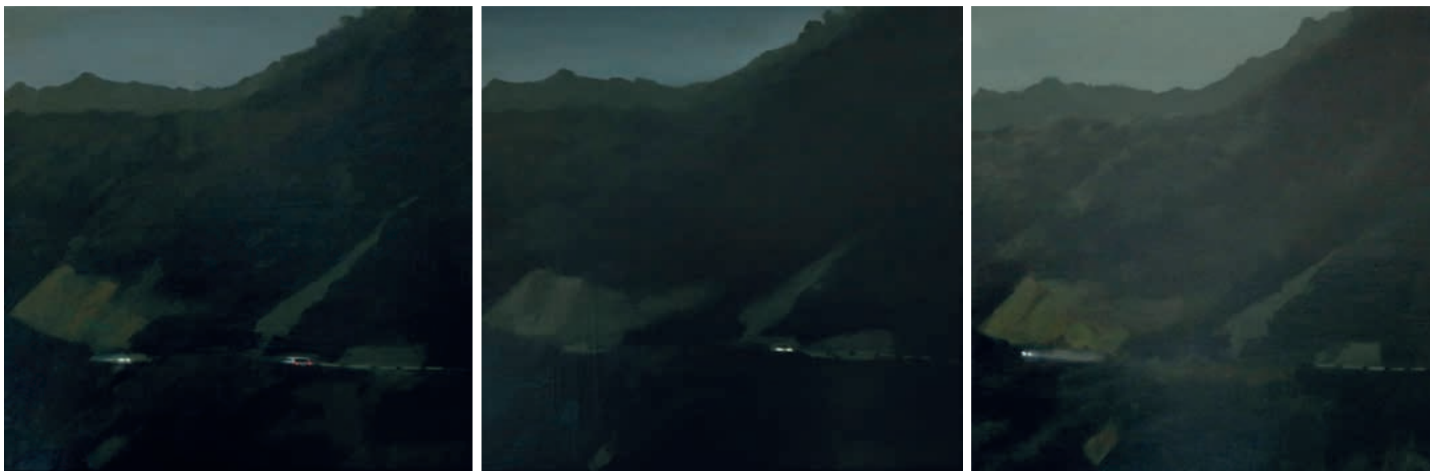
UBRIQUE-CORTES, 1, 2 Y 3 · óleo sobre tabla, 50 x 50 cm c.u., 2026