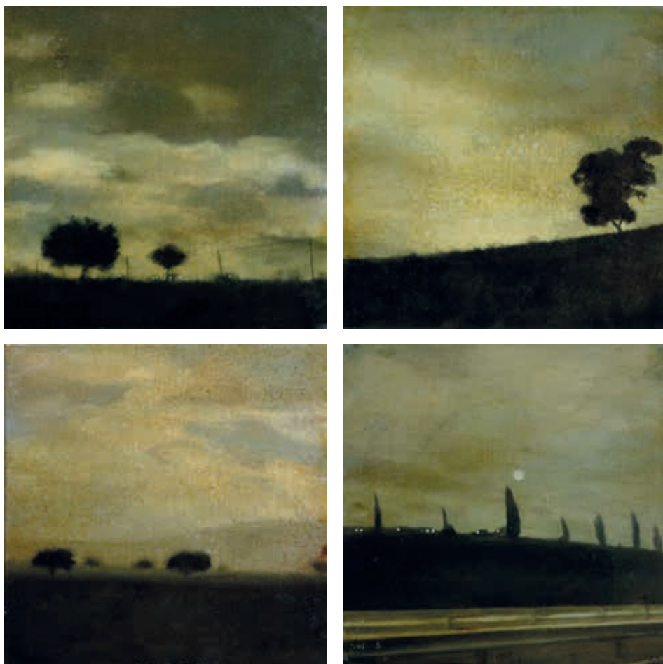
PAISAJES 6, 2, 8 Y 10 · óleo sobre tabla, 22 x 22 cm c.u., 2019