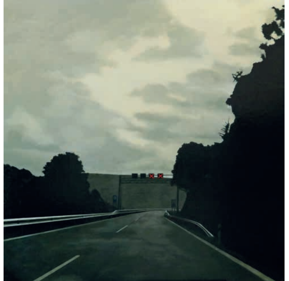
A4, DESPEÑAPERROS · óleo sobre lino, 114 x 114 cm, 2023