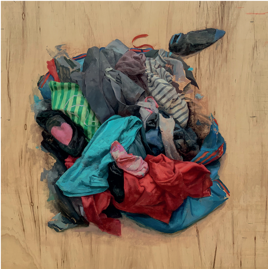
HEAP IV / óleo sobre tabla preparada / 120 x 120 cms. / 2019

Todo comenzó con unos 7 años en esos primeros días de vacaciones de verano donde sobra el tiempo. Alguien decidió que lo ocupara con un cubo de agua, una brocha de encalar y una plancha de amianto. Esa escena de infancia inocente tomó sentido después. No decidí que sería pintora en ese mismo momento, no, pero es sintomático que aún recuerdo el placer que sentí con ese hecho extraordinario: mi cabeza proyectaba, mi mano materializaba y la superficie registraba. Entre la dicotomía del goce del momento y la frustración derivada por la rapidez con la que desaparecían mis trazos por la naturaleza absorbente de la superficie gris, tomé mi primer contacto con la PINTURA .