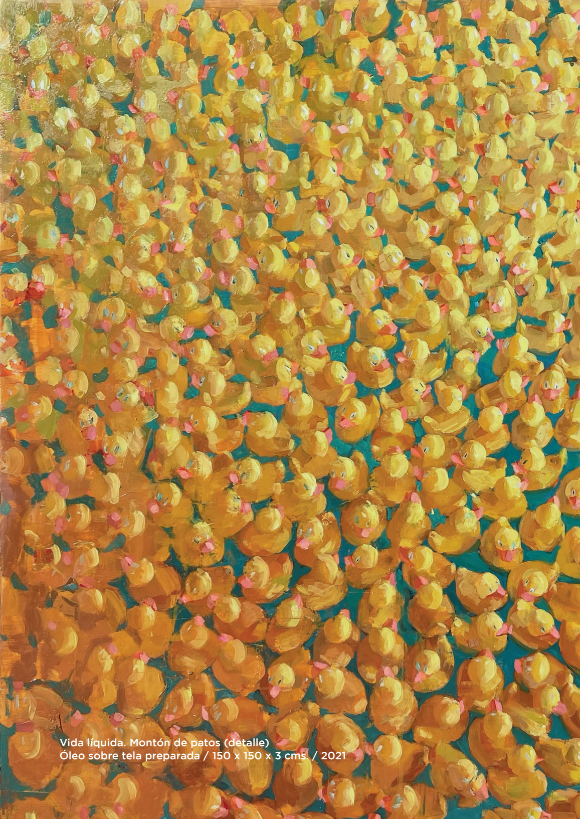
Vida líquida. Montón de patos (detalle) Óleo sobre tela preparada / 150 x 150 x 3 cms. / 2021

Una vez más las puertas de la Sala Rivadavia se abren, en este caso, para acoger la obra de una de las creadoras más interesantes de la actualidad plástica en nuestro país. La pintura de Irene Cuadrado, que fácilmente podríamos reconocer como esa que la crítica tantas veces ha denominado como “ pintura-pintura ”, se muestra ante nosotros con una fuerza, una rotundidad, un oficio y un profundo conocimiento del medio, que es imposible que deje indiferente a las personas que vengan y se sitúen frente a cualquiera de las obras que cuelgan en estas paredes.