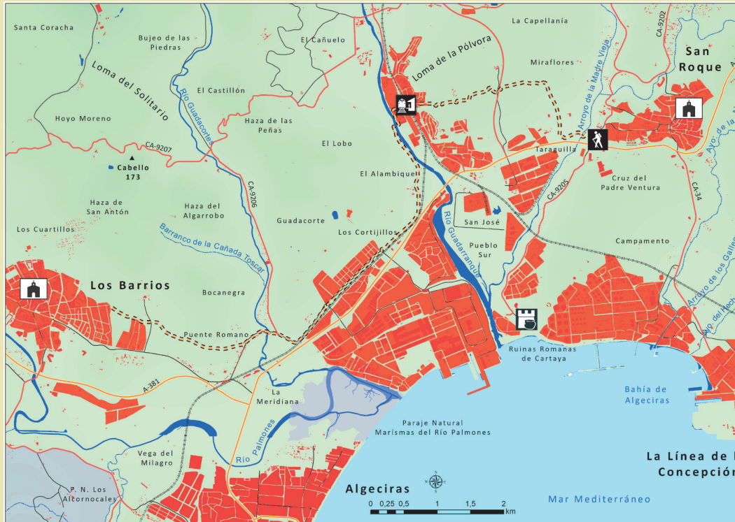
Sendero homologado en mayo de 2025

El recorrido de esta etapa comienza en el Parque de la Vida, desde este punto cruzamos por el puente sobre el arroyo de la Madre Vieja o de Alhaja, ascendiendo a continuación para girar al oeste por detrás del parque de caravanas hasta llegar al camino de San Roque. Desde aquí el sendero enlaza con la colada de la Pasada Honda a la Pólvora Nueva en una zona dominada por la vegetación propia del monte mediterráneo.