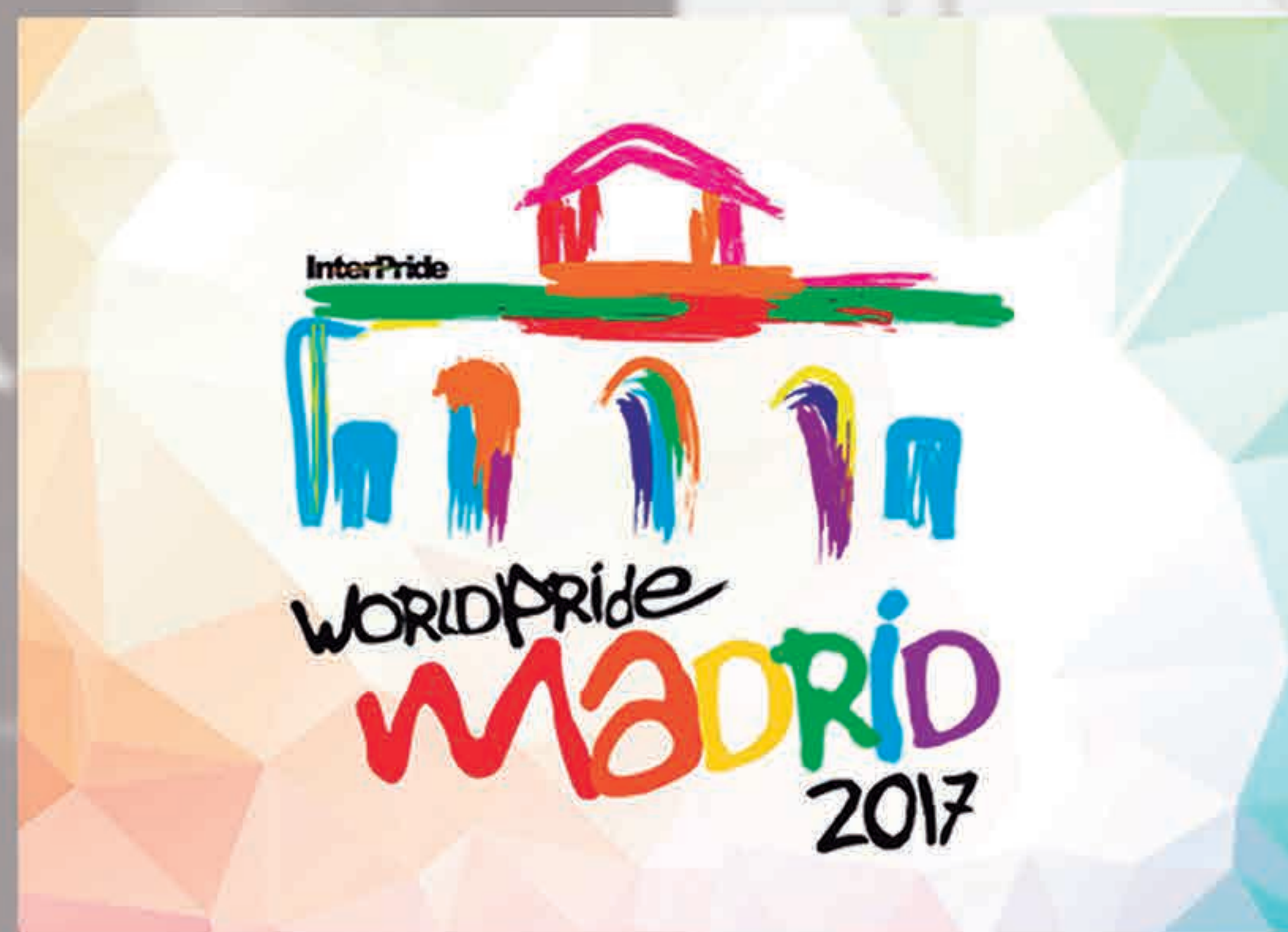
■ Imagen corporativa del World Pride celebrado en Madrid en 2017.