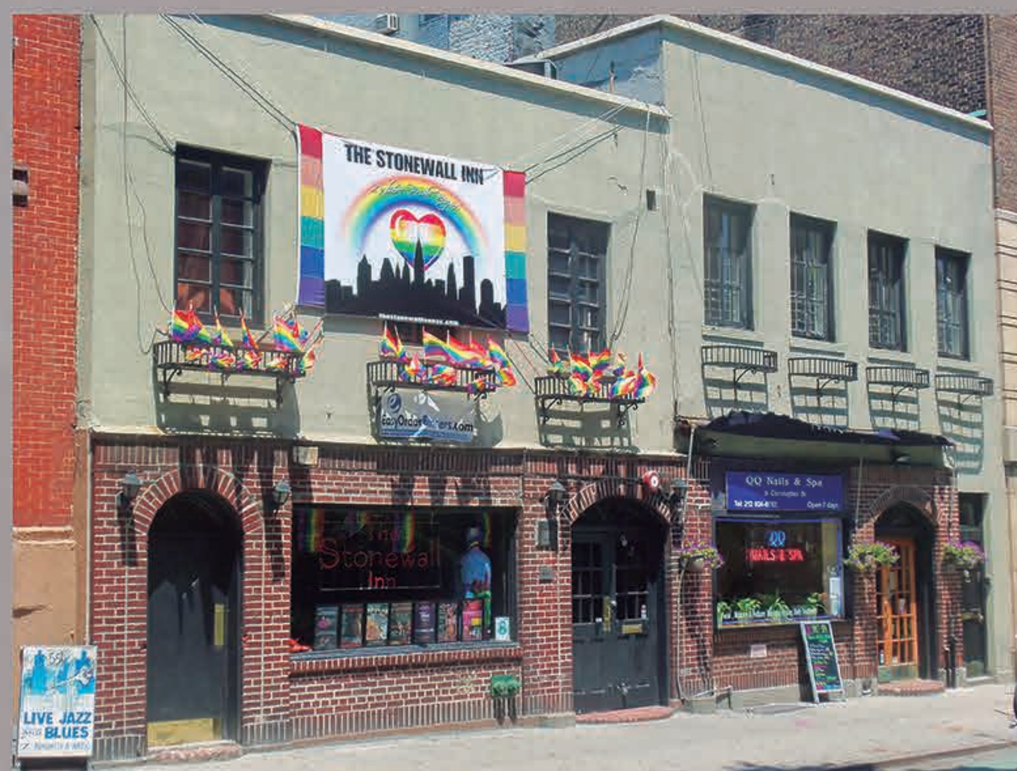
■ Stonewall Inn, New York. 2012. Daniel Case CC.